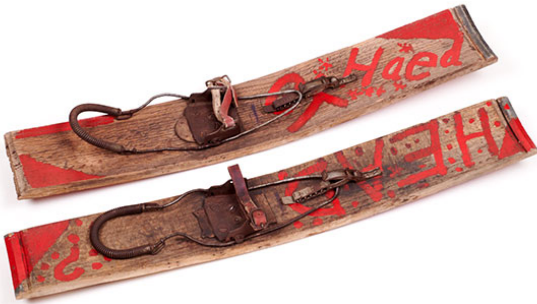
Holzskis aus Fassauben mit Kabelbindung, ca. 1960

Führungsangebot | Magazin bestellen | Mehr über die Ausstellung