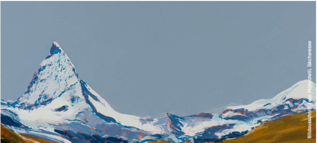
Bildausschnitt: von Moscatelli, Sécheresse