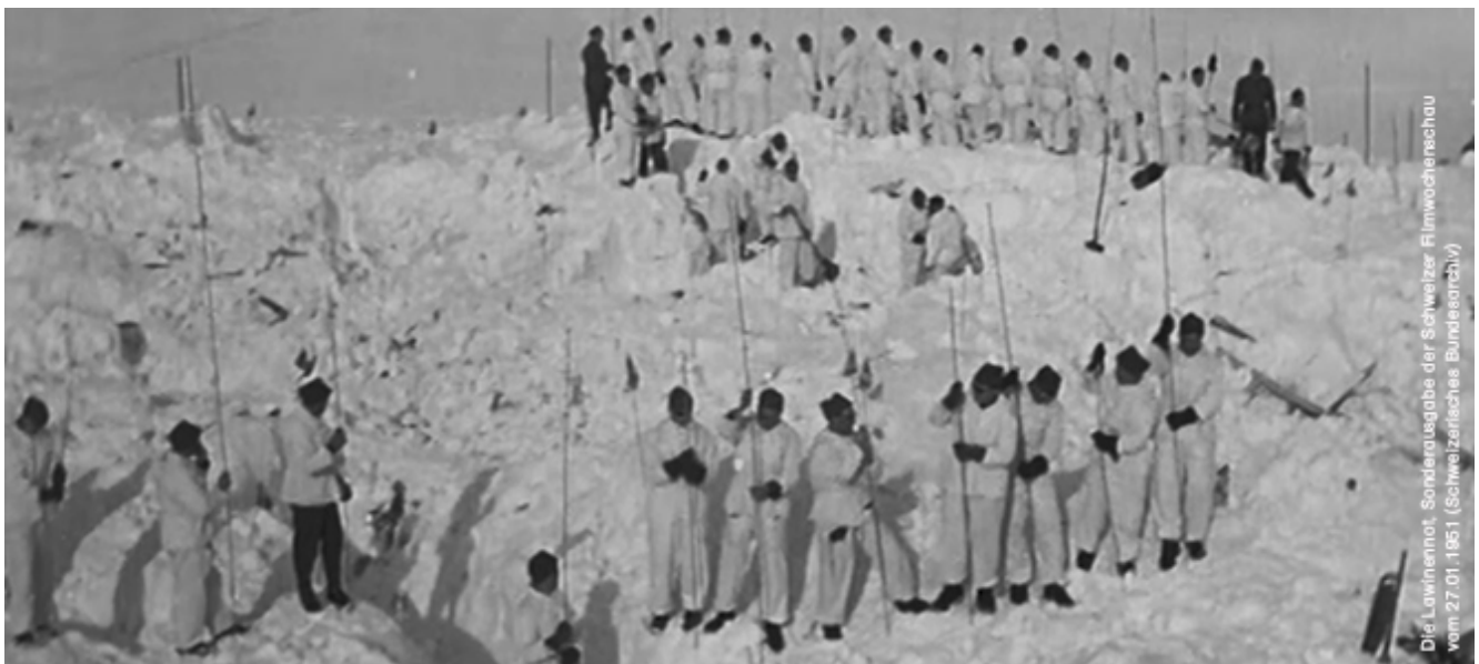
Die Lawinennot, Sonderausgabe der Schweizer Filmwochenschau vom 27.01.1951

bis 21. April 2019 im Raum Biwak | Mehr zur Ausstellung