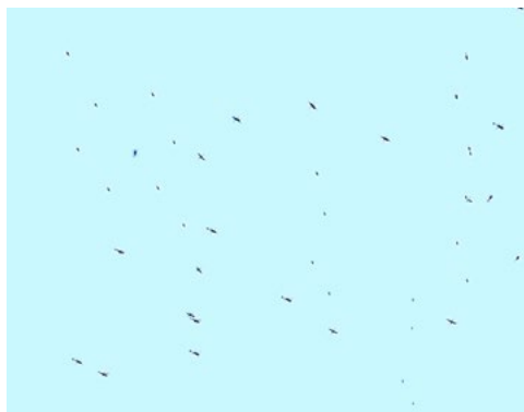
Forum, Video, 2018/19. Flüge der Staats- und Regierungschefs zum Weltwirtschaftsforum in Davos, arrangiert als filmische Komposition.

(Einblicke in die Ausstellung sind ab Anfang September am gleichen Ort zu finden.)