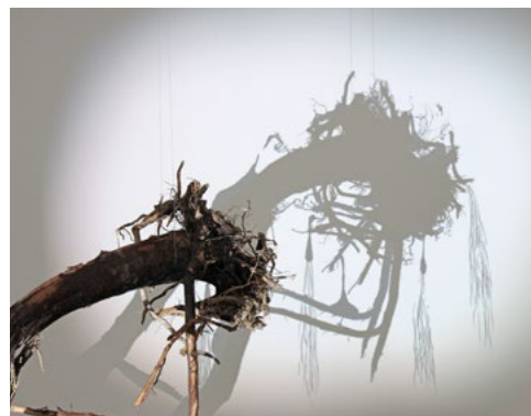
Stock, 2019, Installationsansicht in der Galerie Luciano Fasciati Chur. Ein Wurzelobjekt, das in der Ausstellung weiterwächst.