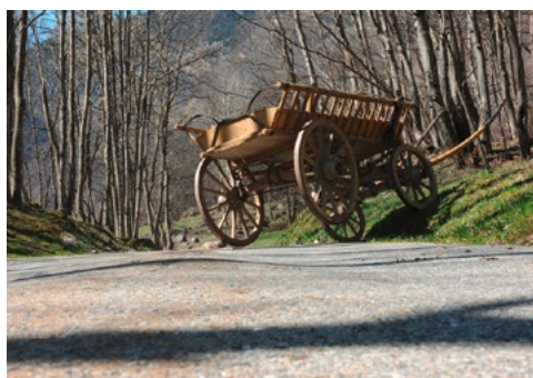
Automobile, Videoinstallation, 2015. Die Fahrt des selbstfahrenden Leiterwagens wird an der Vernissage live von Kappeler/Zumthor vertont.