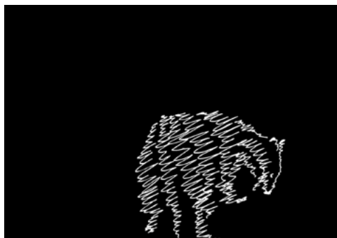
Dachs, Zeichenanimation in Schwarz-Weiss, 2019. Die zweiseitig sichtbare Projektion lässt einen hungrigen Dachs immer wieder im Ausstellungsraum auftauchen.