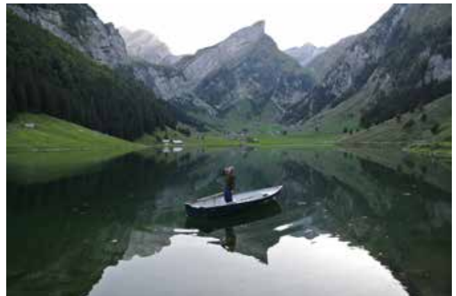
Seealpsee, Alpstein