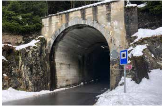
Binn, Binntal (VS)