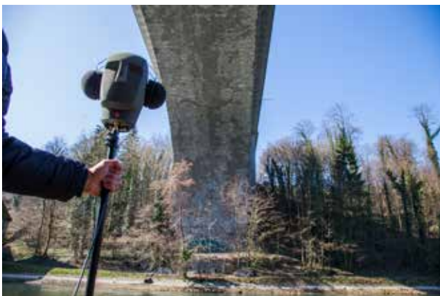
Lorrainebrücke, Bern (BE)