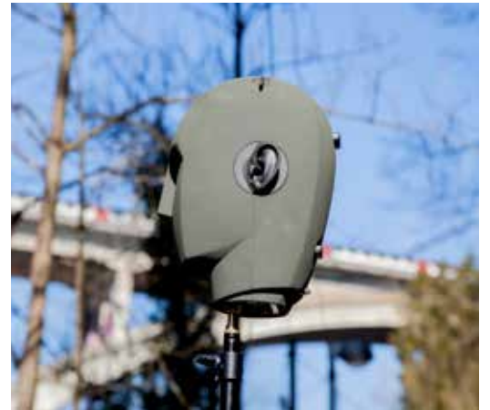
Audio-Aufnahmen mit dem Kunstkopf-Mikrofon unter der Berner Lorrainebrücke.