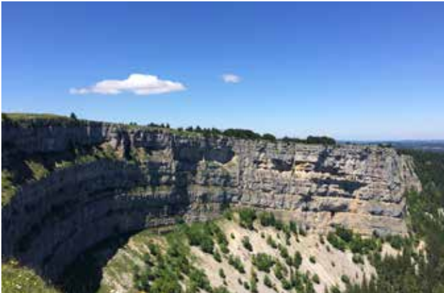
Creux du Van, Val de Travers (NE/VD)