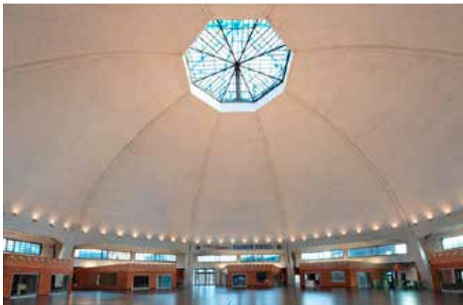
Markthalle, Basel (BS)