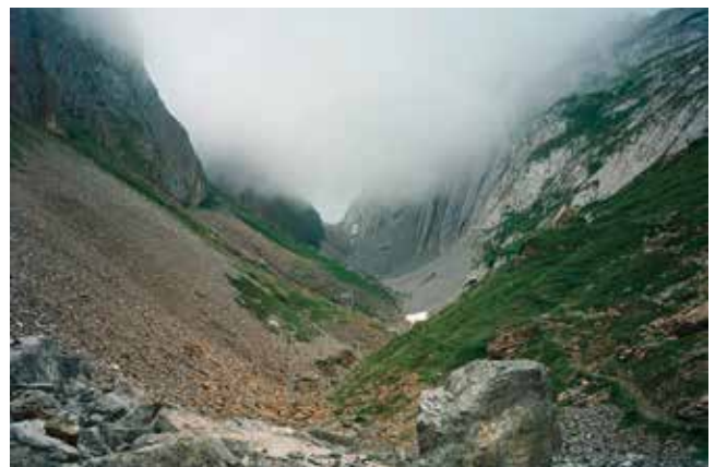
Toralp, Melchtal (SZ)