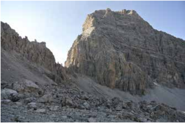
Elapass, Val Spadlatscha (GR) © Christian Zehnder