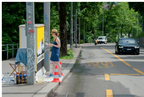
Bierhübeli-Stutz, Neubrückestrasse, Annick Bosson