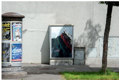
Berna-/Kirchenfeldstrasse, Jeanne Godau