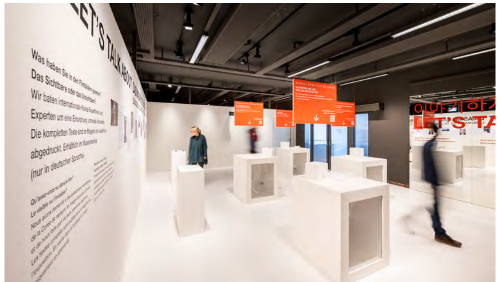
Ausstellungseinblick «Let's Talk about Mountains»