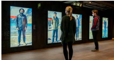
Ausstellungseinblick «Let's Talk about Mountains»