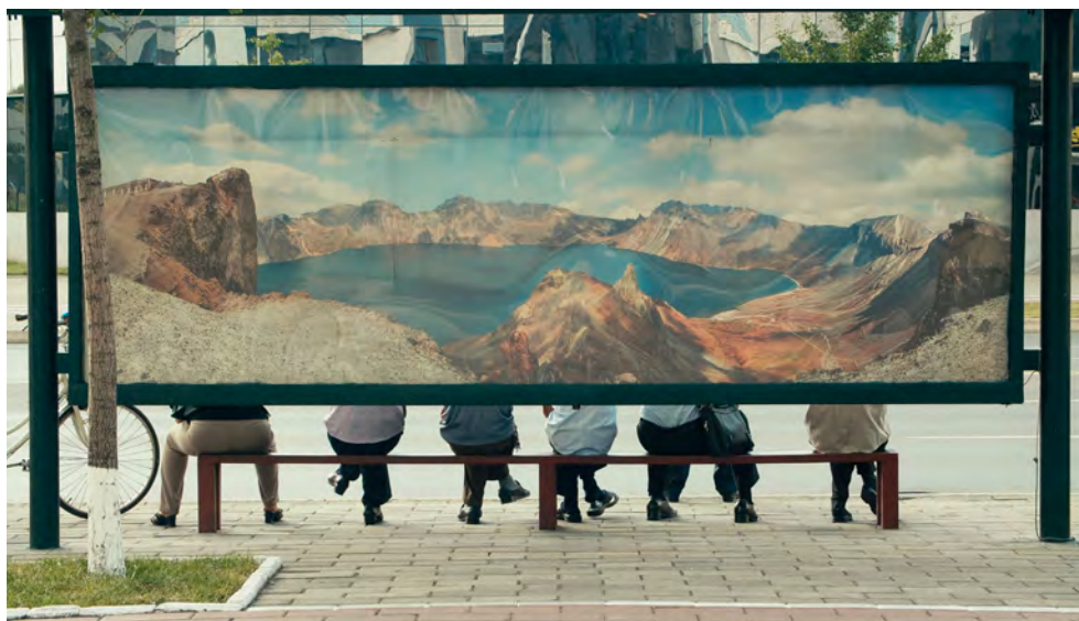
Pjöngjang, Bushaltestelle, Filmstill, ©Katharina Schelling / Alpines Museum der Schweiz