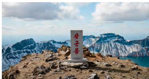
Gipfel Paektusan, ©Gian-Suhner / Alpines Museum der Schweiz