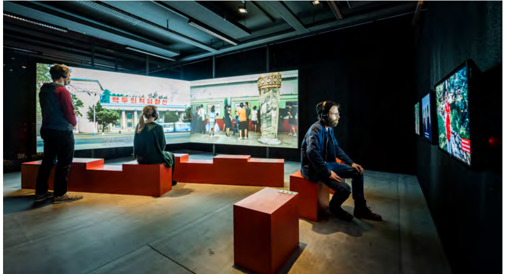
Ausstellungseinblick «Let's Talk about Mountains»