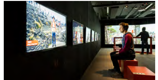
Ausstellungseinblick «Let's Talk about Mountains»