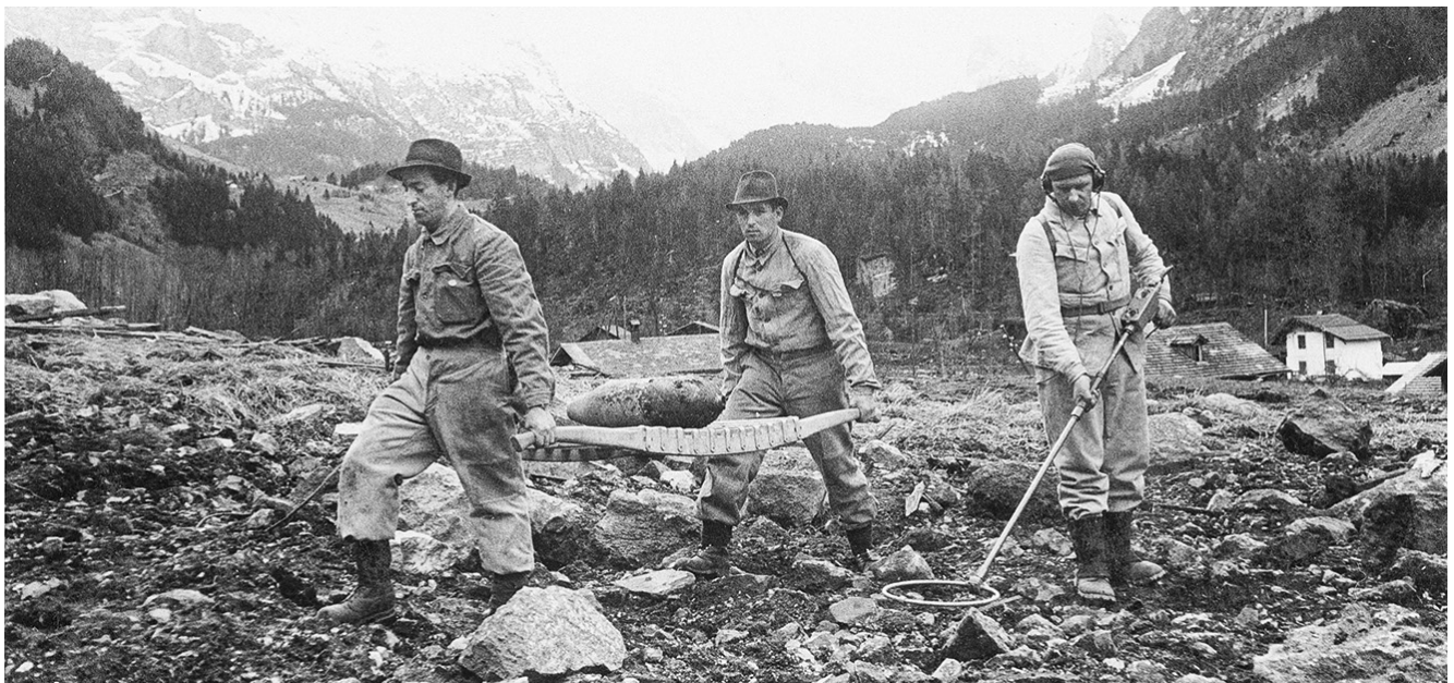
Beide Bilder: Mitholz nach der Explosions-Katastrophe von 1947, Hans Lörtscher, Frutigen © Kulturgutstiftung Frutigland