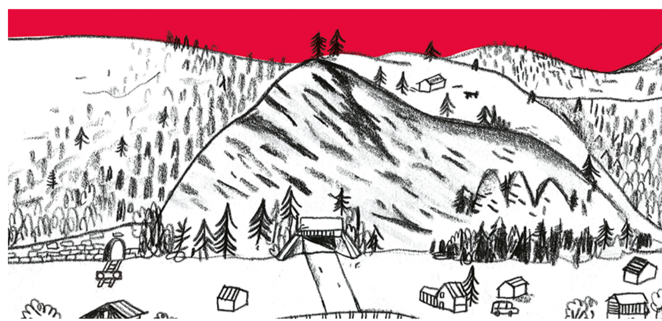
Illustration Munitionslager, Mitholz, Luigi Olivadoti