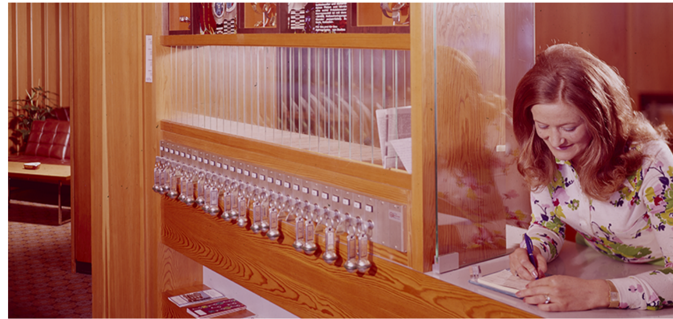
Grandhotel Waldhaus, Vulpera, undatiert, Kunststalt Brügger, Meiringen © Alpines Museum der Schweiz