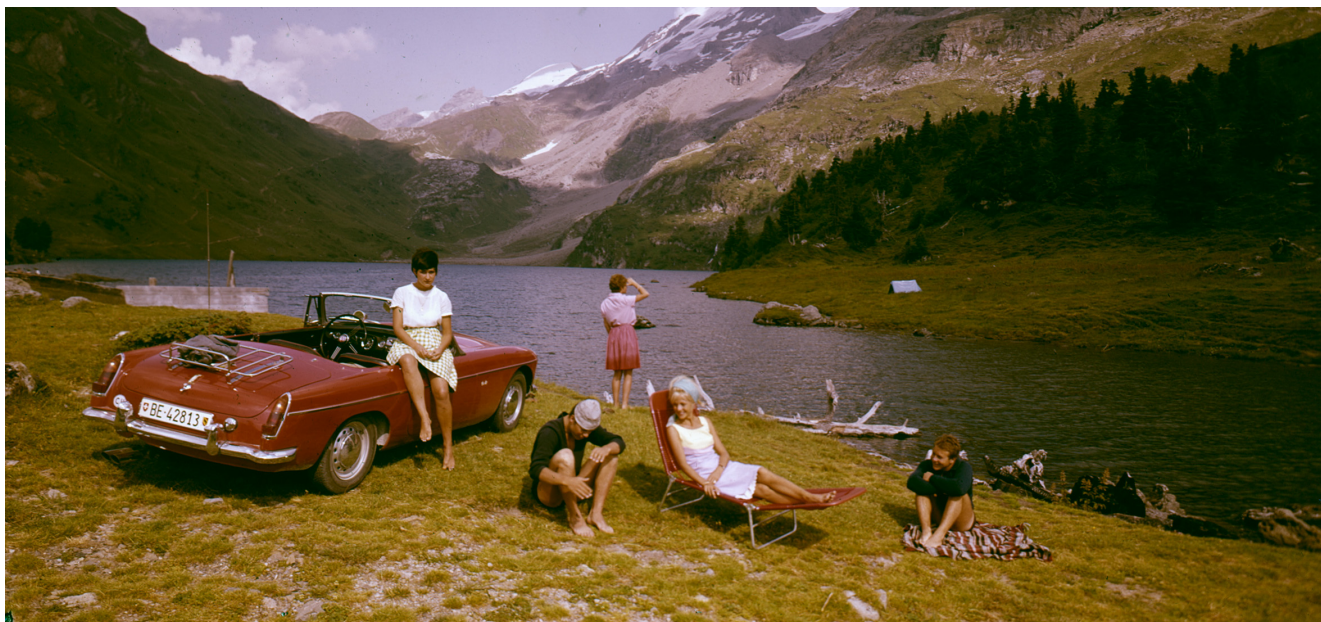
Foto aus der Sonderausstellung im Museo Nazionale del San Gottardo «Der Sonntagsausflug».

Archäologische Neuentdeckungen in den Alpen sind oft Bergsteiger:innen zu verdanken. Doch was tun mit dem Gefundenen? An den beiden Veranstaltungen klärt das Bernische Historische Museum in Zusammenarbeit mit dem Archäologischen Dienst des Kantons Berns und dem Alpinen Museum der Schweiz auf.